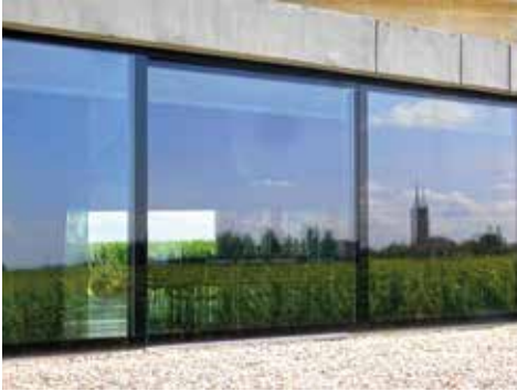
POMEROL - PETRUS - HERZOG ET DE MEURON PHOTOGRAPHIE : XAVIER CLARKE DE DROMANTIN.

Xavier CLARKE DE DROMANTIN, conseiller Architecture DRAC Nouvelle Aquitaine.