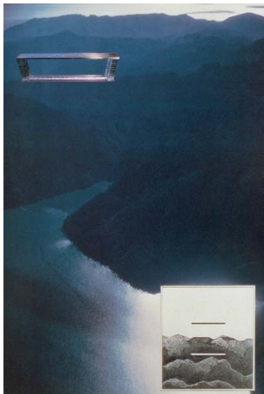
Le monument de la communication France-Japon