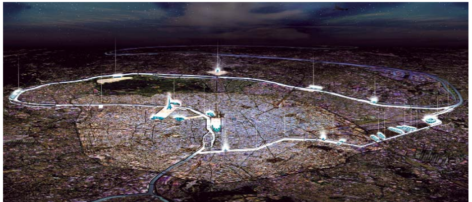
Paris / Saint-Denis, appel à idées pour la candidature de Paris aux Jeux Olympiques de 2008, 2000, Patrick Berger arch. assisté de Jean-Christophe Quinton, arch. © perspective J. Abinal

Selon la Commission, les honoraires doivent être le reflet des compétences et de l'efficacité des architectes – peut-être aussi de leur réputation – et des coûts qu'ils supportent, et ne doivent pas être uniquement fonction de la valeur des travaux ou du prix de l'entrepreneur. En toute hypothèse, l'architecte doit fixer ses honoraires indépendamment de ses concurrents et exclusivement en accord avec le client.