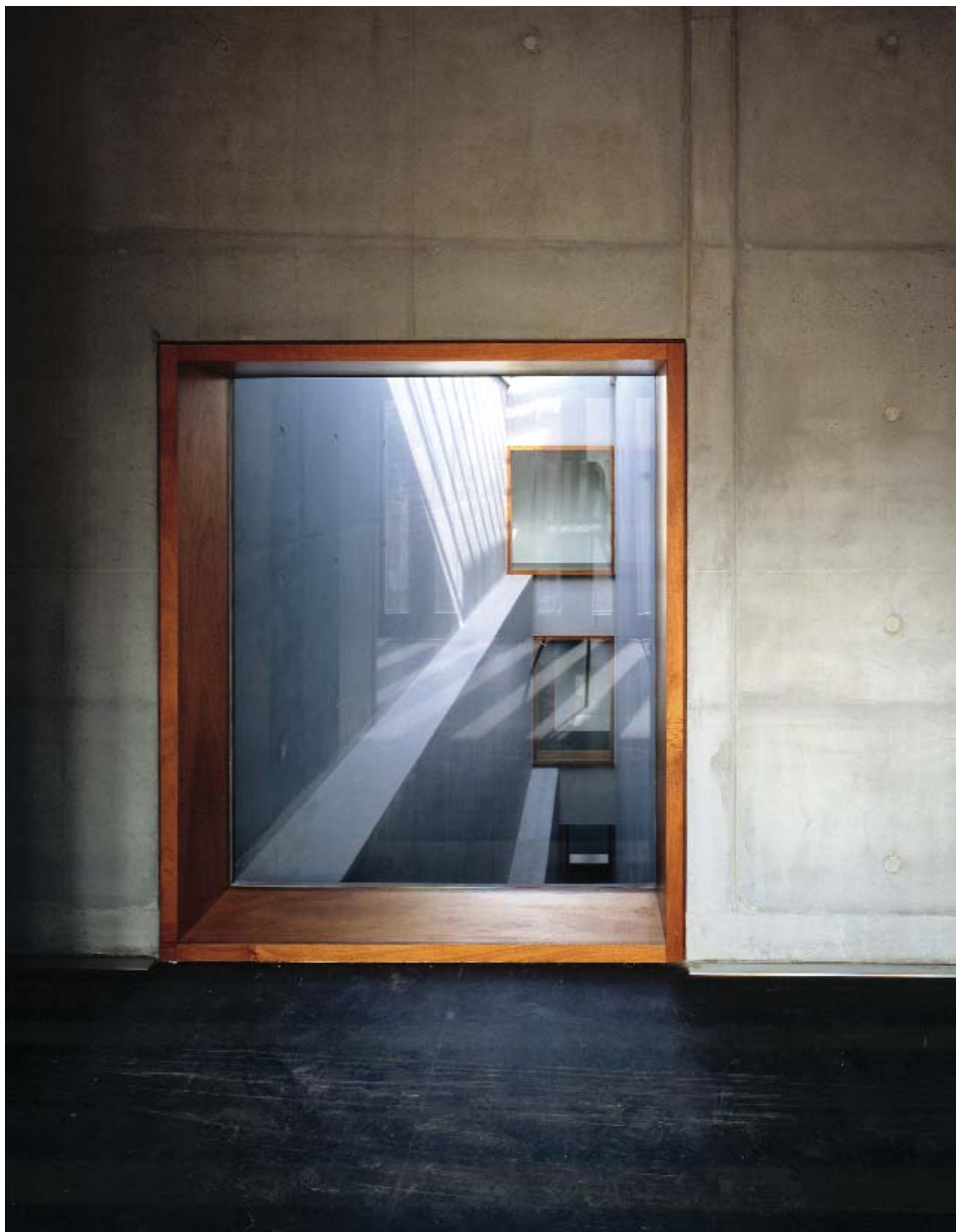
Centre socio-culturel pour la RATP, Paris, 2003, Patrick Berger et Jacques Anziutti, arch. associés

Nous réfléchissons en commission formation à un système ouvert qui intègre des valeurs de points équivalant à des formations, des abonnements à des revues professionnelles, l'implication dans des structures professionnelles syndicales ou associatives, les participations à des colloques ou à des voyages d'études etc. Deux journées par an de formations obligatoires pourraient être un minimum commun à tous les architectes, les autres activités citées ci-dessus, venant compléter la formation.