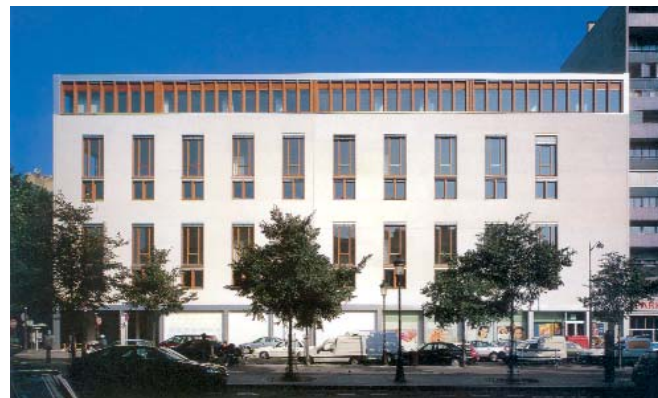
Ateliers et logements d'artistes, Paris, 1999, Patrick Berger et Jacques Anziutti, arch. associés © F.J. Urquijo

Dans les cas où une déclaration de travaux, une autorisation d'installation et de travaux divers, un permis de construire ou un permis de démolir sont nécessaires, et si le préfet de région infirme l'avis de l'ABF sur saisine du pétitionnaire , le maire ou l'autorité compétente doit statuer à nouveau dans le délai d'un mois suivant réception de l'avis du préfet.