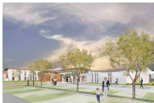
Centre hospitalier de Châteaurox (36) - IVARS BALLETT