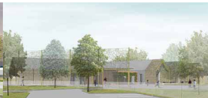
Ecole maternelle - Saint-Denis les Ponts (28) - TROUVE TCHPELEV