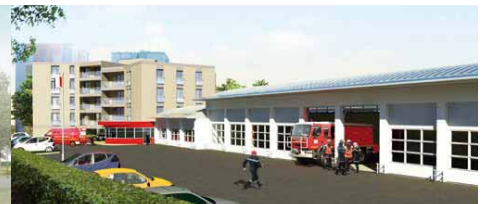
SDIS (18) - BRUNET VIGNON